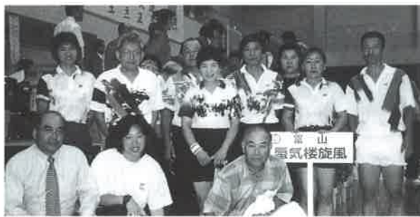
年齢別バドミントンに出場された選手の皆さん

この4日間の大会で得たこと、そして感動を心に刻み、今後の教育、体育活動に生かしていきたいと思えます。