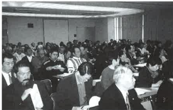
(熱心に講演に耳を傾ける参加者)

講演の後、受講者からの質疑応答があり、「総合型スポーツクラブ」の展望について本音の意見交換が行われました。その中で、新しいことには「痛み」が伴うが、今までのスポーツ活動につき込んできたスポーツリーダーの情熱は大きな財産であり、すべての人々が充実したスポーツライフを送ることができるよう、一層の研鑽を重ねていくことを確認しあいました。