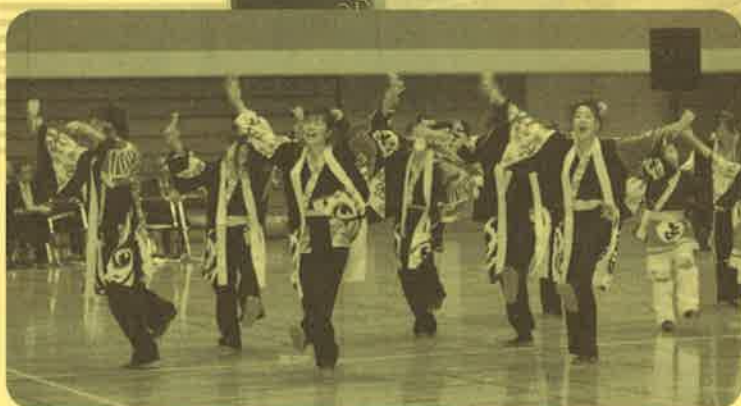
オープニングアトラクション「よっしゃKOI」の華麗な舞