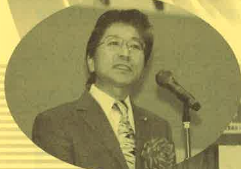
分家射水市長 歓迎の言葉