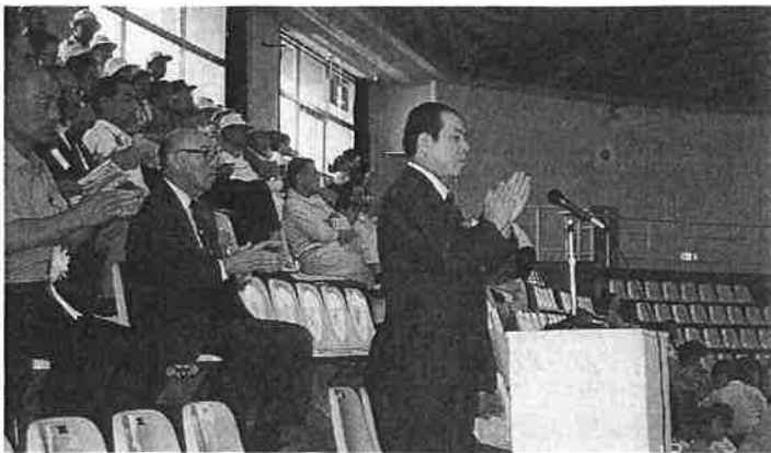
中日本大会長の挨拶