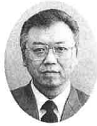
富山市民病院内科部長