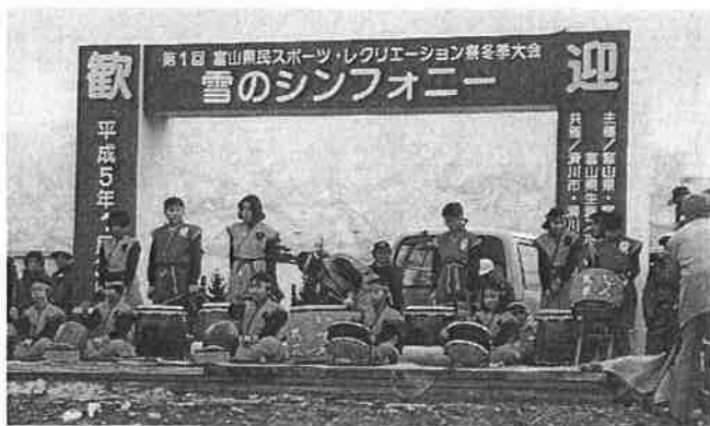
力強い音色 雪のシンフォニー「上小泉いずみ太鼓」